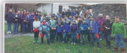
L'oro blu del Parco delle Gole della Breggia